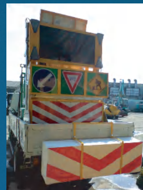
運搬や保管の時は縮めて保管