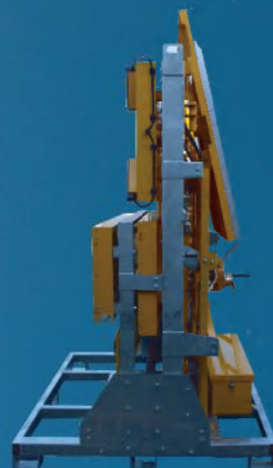
パネル折りたたみ式