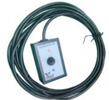
ガードマンリモコン (※オプション品)